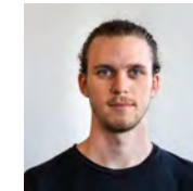
Public Relations Hudson Muff

Anlässe Medien Eye of the tiger Werbung Website